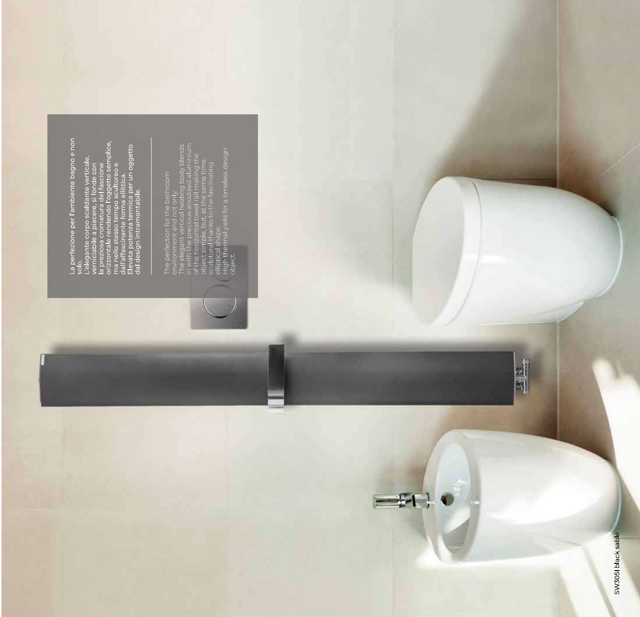
SW3051 black sable