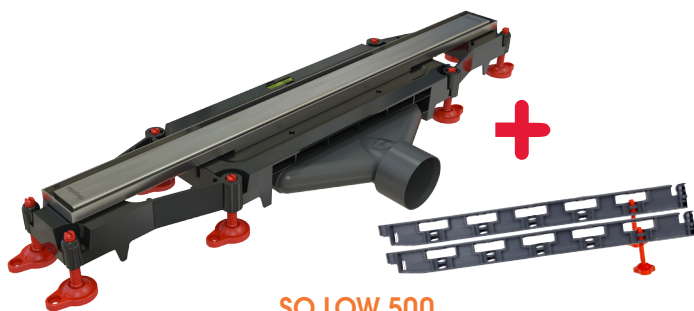
SO LOW 500